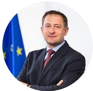
Komisarz ds. Rolnictwa & Żywności Christophe Hansen